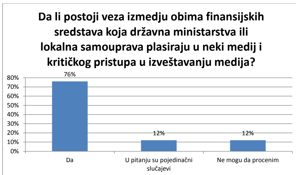
Infografik 2: Veza između državne pomoći i pristupa izveštavanju

Direktnu ili indirektnu finansijsku podršku od države ili lokalne samouprave tokom posmatranog perioda dobilo je 22 od 25 anketiranih medija (88%), 8% ispitanika nije dobilo pomoć, dok 4% nije sigurno da li je uopšte dobilo ili nije.